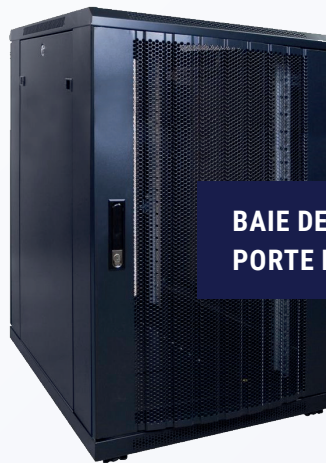
BAIE DE BRASSAGE AVEC PORTE PERFORÉE