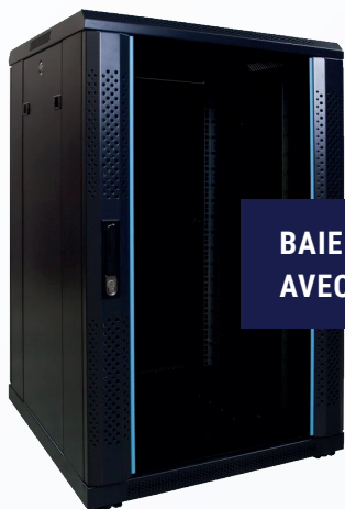
BAIE DE BRASSAGE AVEC PORTE EN VERRE