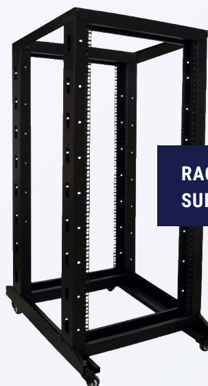
RACK RELAY SUR ROUES

(également disponible en version inclinable)