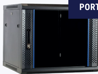
BAIE MURALE AVEC PORTE EN VERRE

(également disponible en version inclinable)